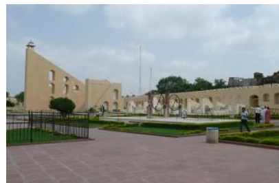
↑巨大な天文観測機器が並ぶ ジャンタル・マンタル (ジャイプル)

日印教育支援センターは、インドにおいて教育を受ける機会のない子どもたちのための学校支援を軸に、日本とインドの教育交流・文化交流活動を推進する団体です。