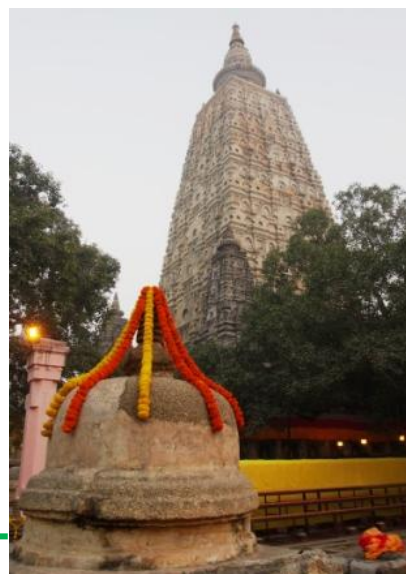
↑ブッダが覺りをひらいた 仏教の聖地・マハーボディ寺院 (ブッダガヤ)