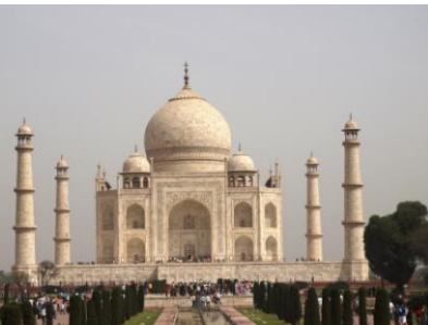
↑インドで最も有名な世界遺産、 タージ・マハル (アグラ)