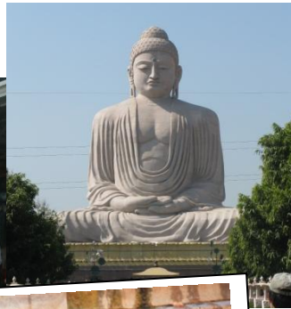
←ブッダガヤの大仏像。