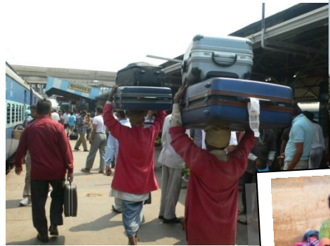
↑旅情あふれる列車の旅を体感。

仏教の聖地ブッダガヤには、世界各国から仏僧や仏教徒が集まり、寺院も多くあります。それぞれ特徴のある各国寺院巡りや、仏教の歴史を感じる考古学博物館を訪問します。ヒンドゥー教の聖地ヴァラナシでは、聖なる河ガンジスでの沐浴風景、火葬の火が絶えることのないマニカルニカー・ガートなど、神秘的なインドを体験します。