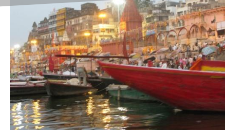
↑ガンジス河でボートに乗って日の出を観ます。沐浴する人々の姿も厳かです。(ヴァラナシ)